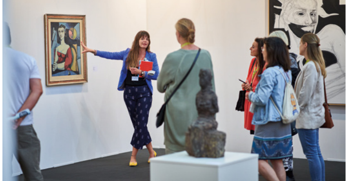
art KARLSRUHE Besucher vor „Ritratto di Donna“ von Dario Fo, 1948 aus der Sammlung Klöcker