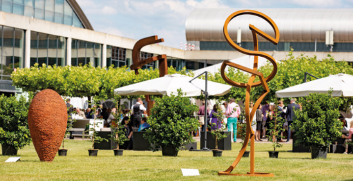
Blick in den Skulpturengarten 2022