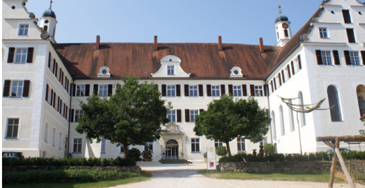
Schloss Mochental, Galerie Schrade | Skulptur: Wonne-bi von Dietrich Klinge, Bronze 2006