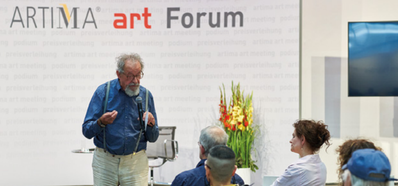
ARTIMA art Forum: Kasper König während ARTIMA art meeting 2022